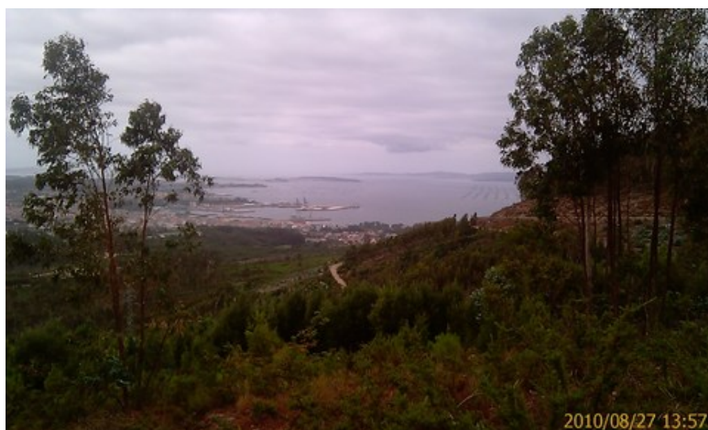
Villagarcia et du port