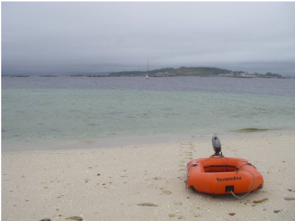
L'annexe et le fidèle

Jedi 26 août (et dans la foulée, vendredi 27) : il fait beau, il n'y a plus personne ni au mouillage ni sur l'île, c'est notre tour d'aller s'y dégourdir les jambes. Mais rapidement, hein, parce que le vent souffle fort et ça serait bien que Schnaps n'aille pas se promener plus loin sans nous.