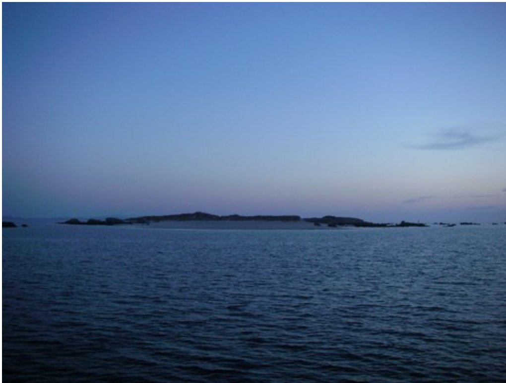
vu du mouillage