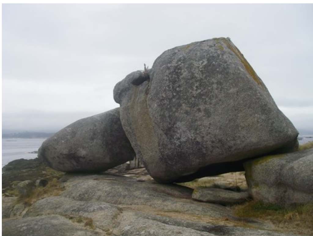
Encore des pierres, au bord de l'eau