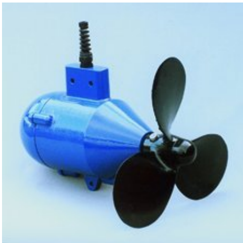
L'Aquair UW 100

Nous avons opté pour la dernière solution, qui semblait présenter le moins d'inconvénients. Et avons trouvé un des seuls produits (si ce n'est le seul) disponibles à l'époque sur le marché grand-public : l'Ampair 'Aquair' UW 100, qui n'est rien de plus qu'un gros alternateur relié à une grosse hélice, destiné à être placé dans un écoulement. Conçu à la base pour produire de l'énergie à bord de bouées scientifiques tractées par des navires d'études sismiques (les bouées doivent être tractées à bonne distance pour ne pas être perturbées par les bruits des propulseurs du navire et ont donc besoin de leur propre alimentation électrique), mais probablement adaptables sur des voiliers. Sur le net, personne ne semblait avoir franchi le pas d'installer cette grosse bestiole à l'arrière de son bateau, ou personne n'osait en parler. On s'est dit qu'il n'y avait pas de raison que ça ne marche pas, et que ce serait quand même chouette de pouvoir produire 1 ampère par nœud en permanence.