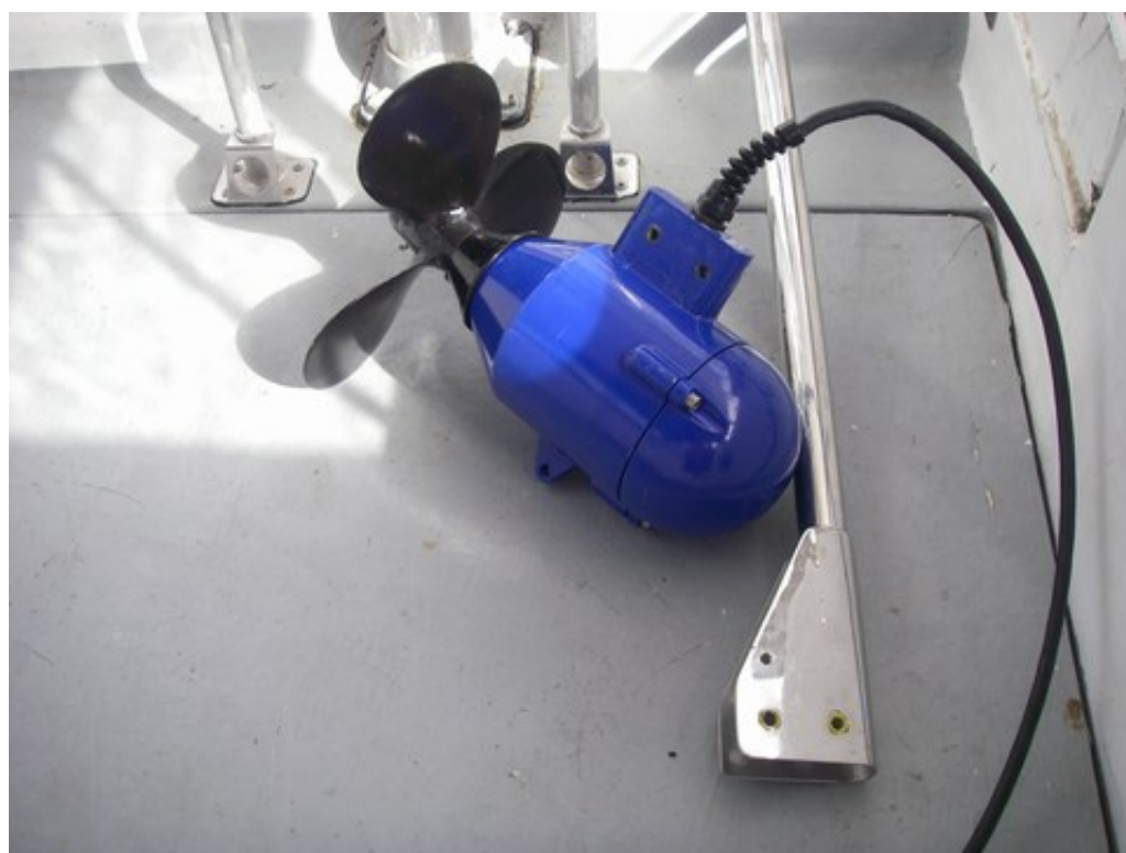
le cockpit, avec son tube de support en inox