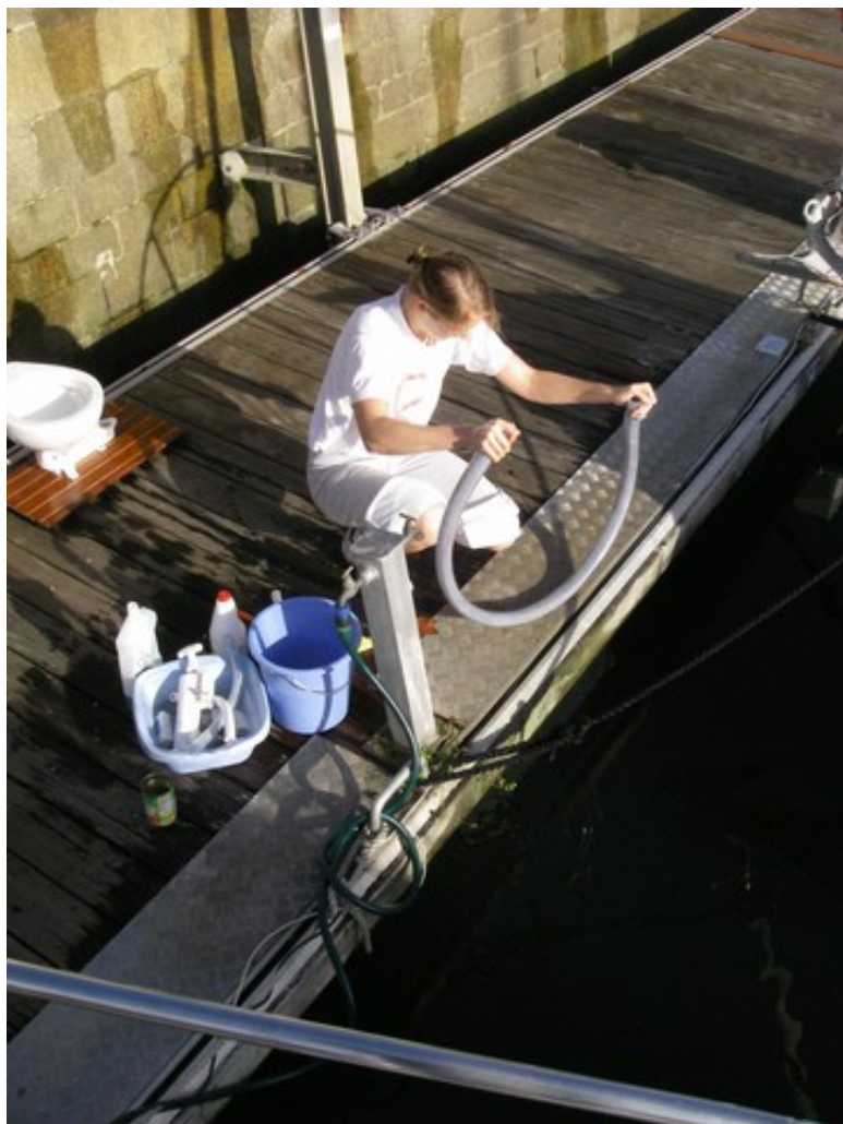
Clairette et l'eau de javel en pleine