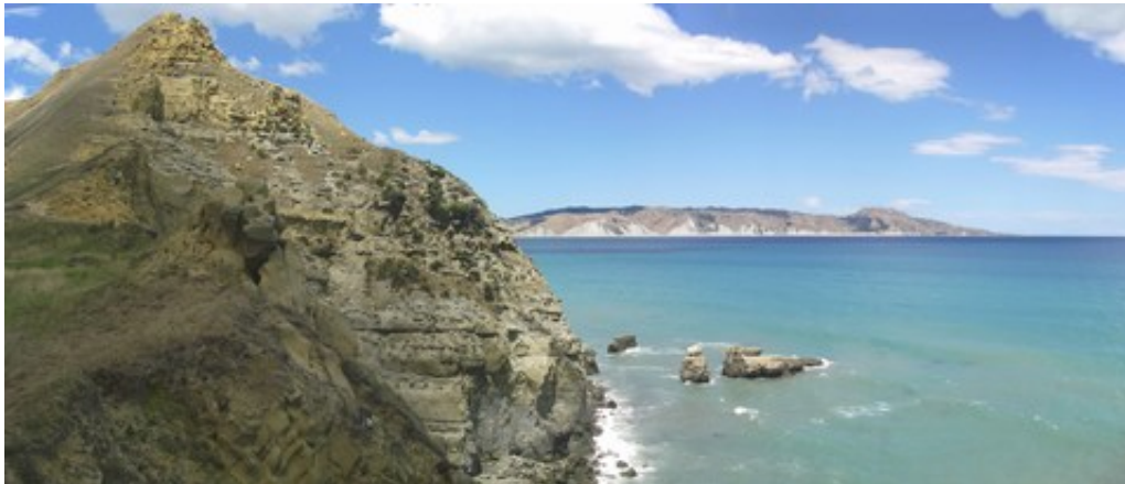
La péninsule de Mahia, entre Napier et Gisborne

retournerait bien à New Plymouth du côté du Mont Egmont pour y faire des balades par beau temps, la Forgotten World HighWay n'est pas inoubliable, la côte Est et son arrière-pays sont superbes, et la péninsule de Coromandel on a boycotté parce qu'ils interdisent le camping sauvage, sous prétexte que les freedom campers (les gens qui font du camping sauvage) laissent des déchets partout. C'est vrai qu'on a de temps en temps vu des détritiques dans la nature : des sacs poubelle de 100 litres, un repas de midi jeté par terre, des morceaux de dalle de béton armé avec des gros gravats, des vieux fauteuils troués, une voiture carbonisée (accident de réchaud, probablement), des commodes défoncées ... C'est fou, non, ce que les freedom campers peuvent laisser sur leur passage ?