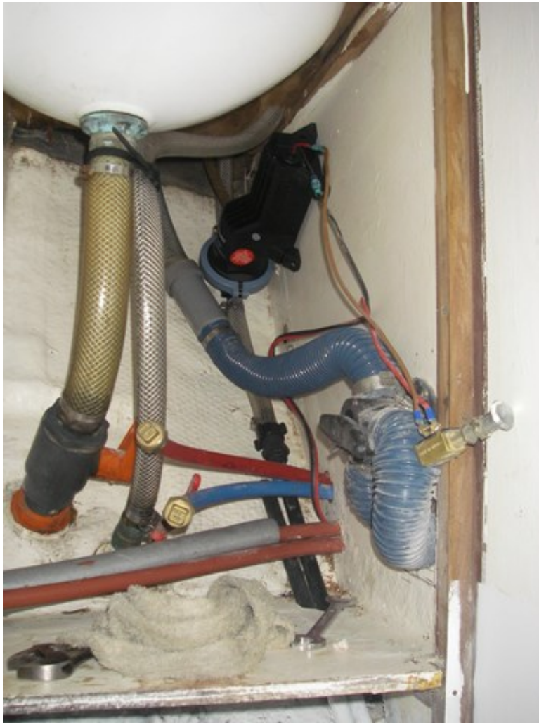
Montage de la pompe, les autres extrémités des 2 tuyaux noirs arrivent au point le plus bas de la petite cuvette