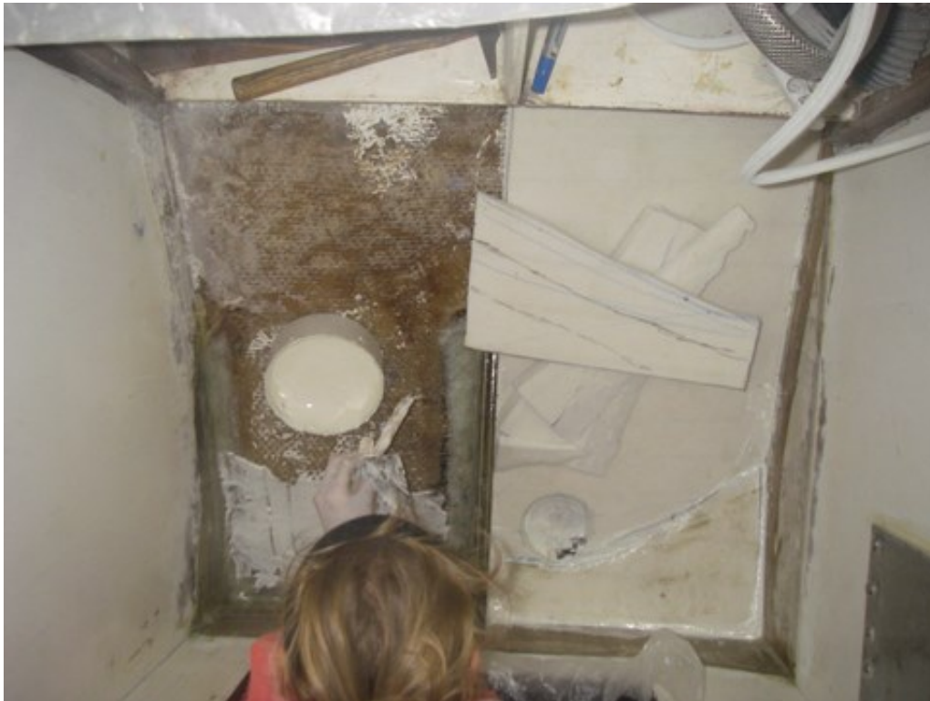
Mise en place et collage des morceaux de mousse