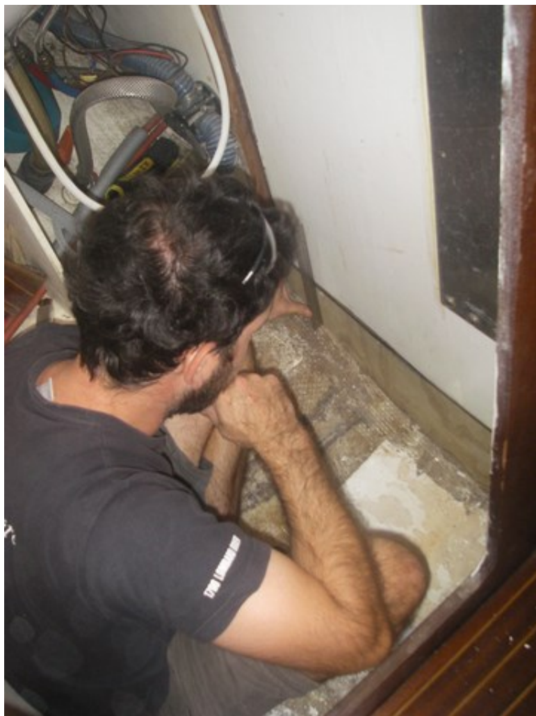
Ajustement d'un nouveau bas de cloison en contreplaqué