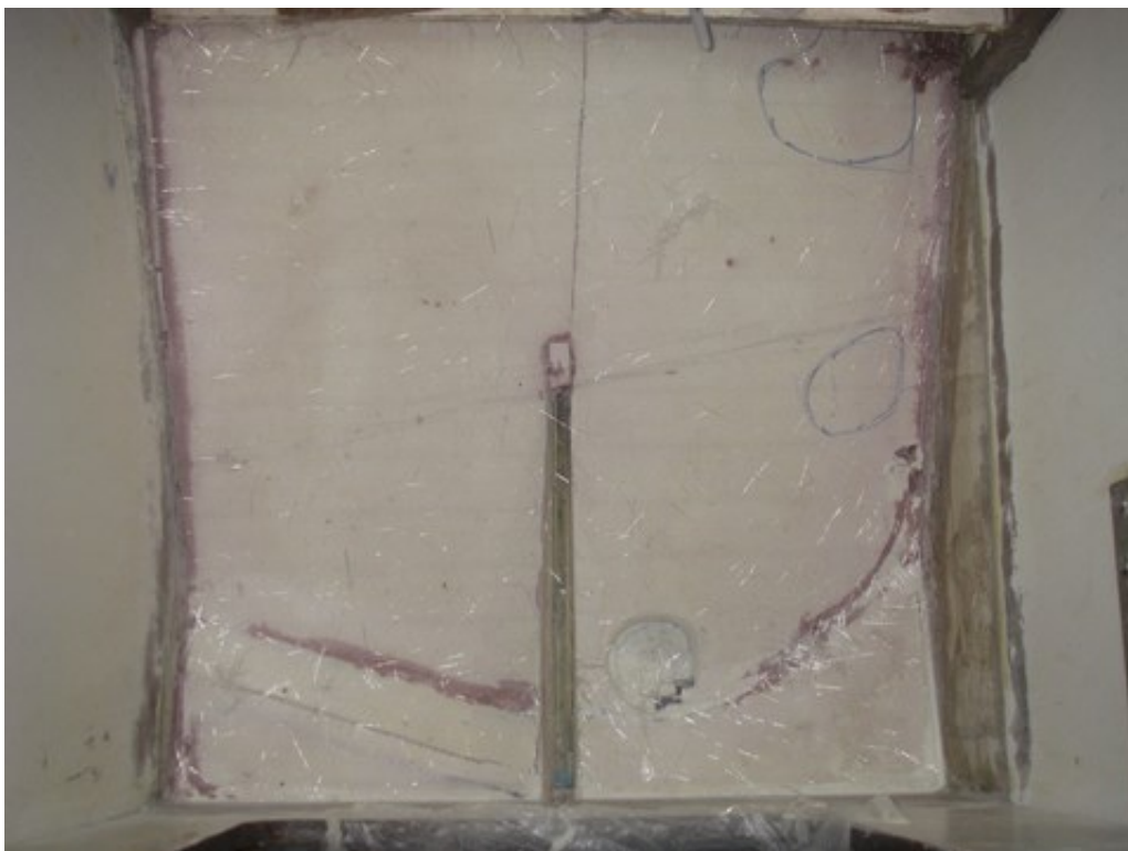
collé, on distingue bien la petite cuvette et l'arrivée des deux tuyaux