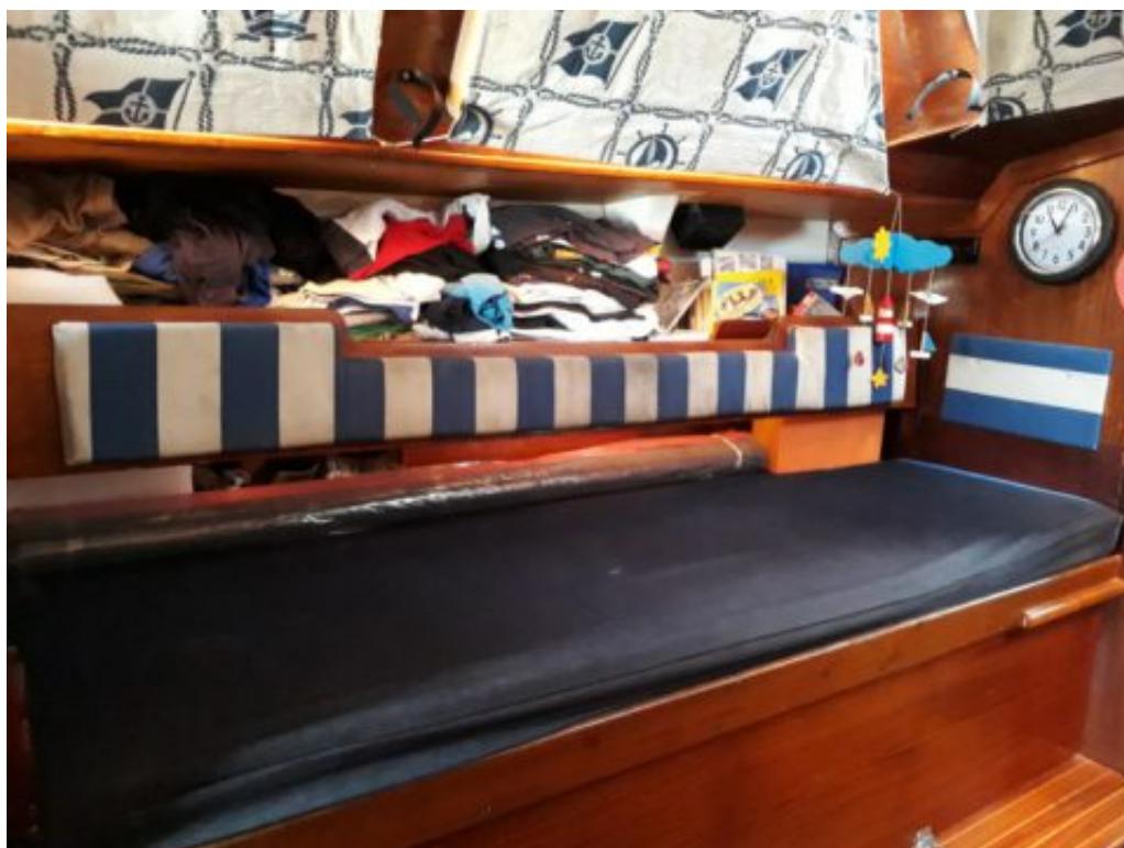
Le côté bâbord, pareil...