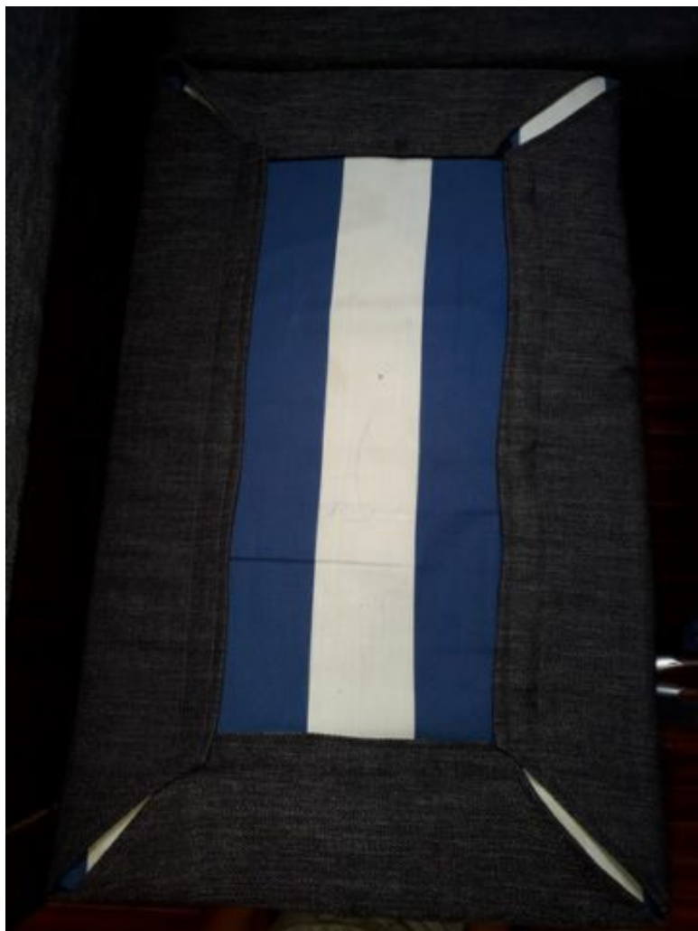
Un coussin vu de dessous