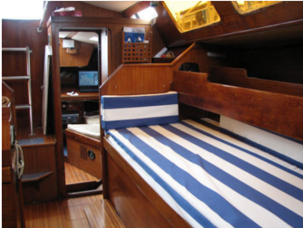
Le carré côté bâbord, pas mal non plus

Puis on a acheté Schnaps, et on a commencé à y vivre. La saleté aussi... Si les housses de coussins étaient amovibles (donc lavables), les housses de dossiers ne l'étaient pas et ont commencé à accumuler la crasse. De plus en plus visiblement sur les bandes blanches – ou plutôt marron-grises. A vrai dire, les housses de coussins ont également rapidement commencé à passer au motif rayures bleues et maronnasses. Précisons que le déhoussage n'est pas aisé, ce qui réduit l'envie de faire un lavage hebdomadaire, mais aussi que le tissu utilisé (un tissu à store) a tendance à conserver la couleur de la saleté au lavage. Nous avons donc – en tous cas après chaque lessive – des housses pleines de crasse propre. L'élégance des rayures était partie en fumée.