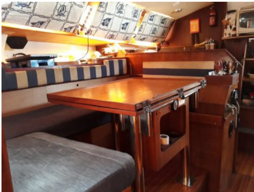
des motifs laisse à désirer