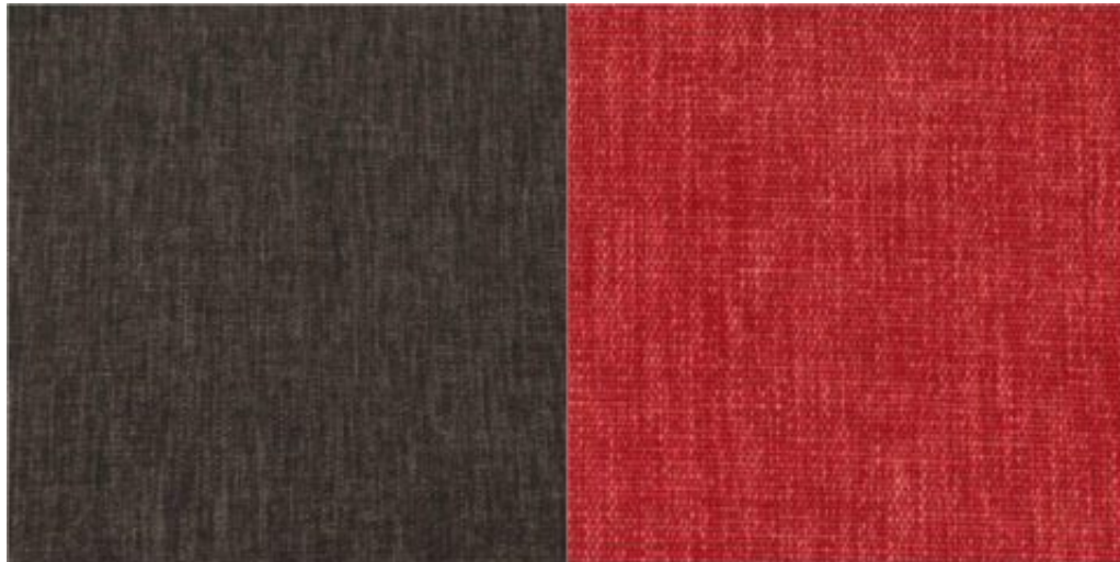
Key Largo, coloris