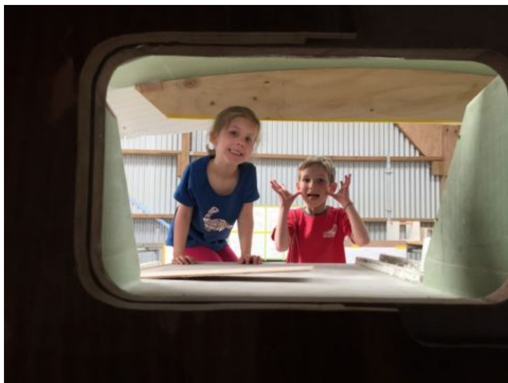
Les loulous visitent

On vous avait montré la dernière fois l'ouverture entre la cuisine et le cockpit. Cette fois on l'a montrée aux loulous, qui ont trouvé rigolo de pouvoir faire des grimaces quand ils sont dans le cockpit.