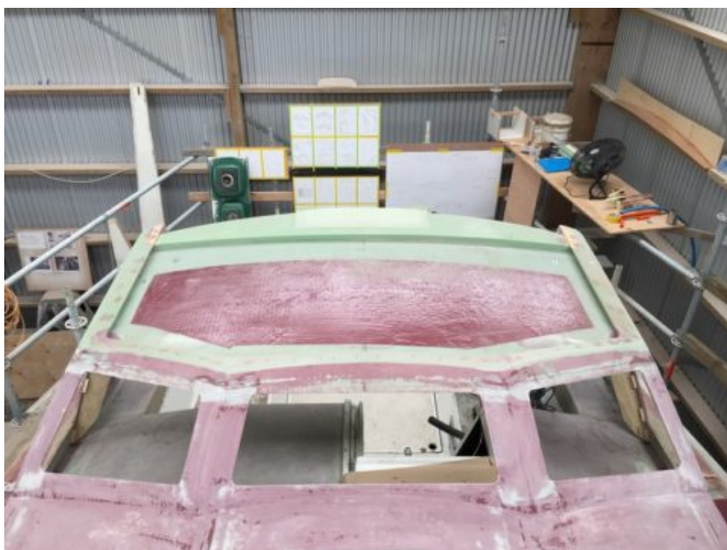
La capote vue du pont

Sur le toit de la capote, on voit assez bien une sorte de renflement qui fait des bords. Sur les côtés, les bords seront bien pratiques pour se tenir quand on passe, et en plus de faire un espace pour des panneaux photovoltaïques un de ces jours, ils forment aussi une baignoire