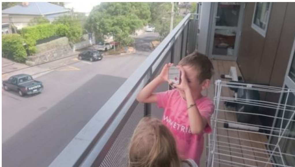
Bouzouk apprend à utiliser le miroir pour éblouir le navire qui va nous porter secours