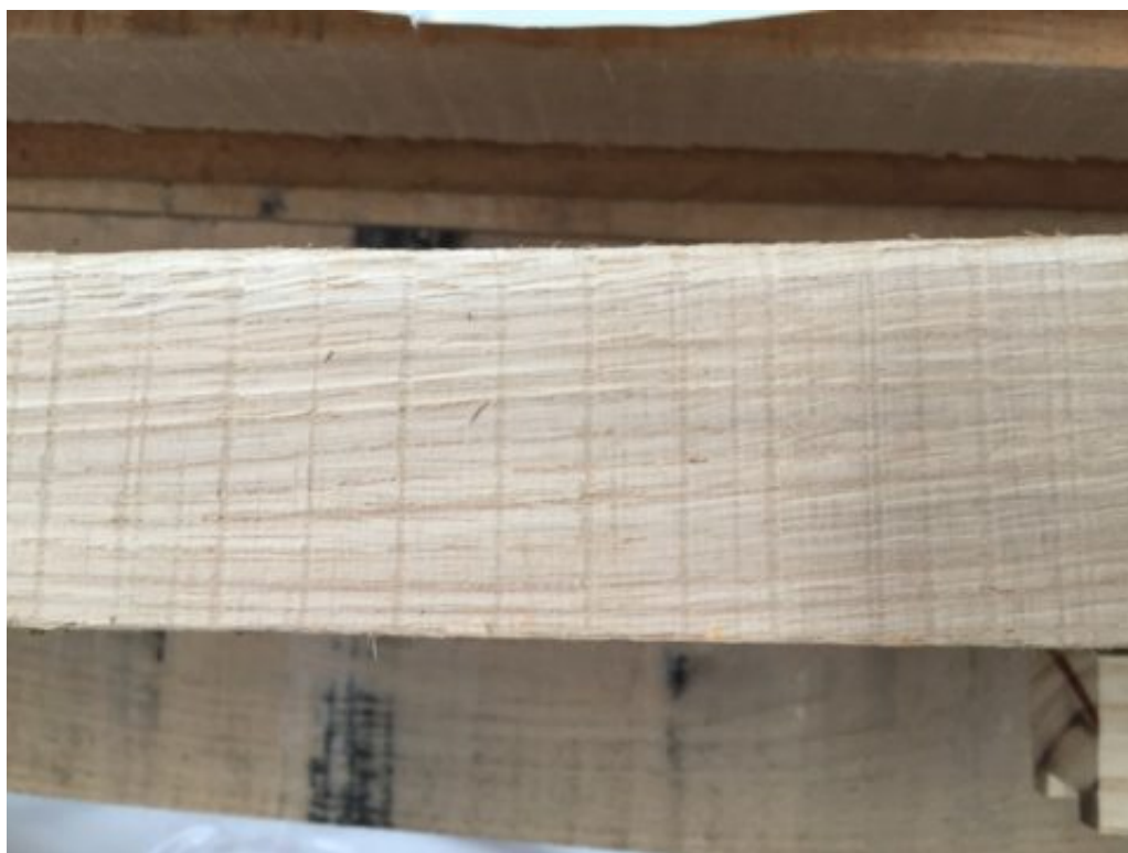
Et un zoom sur le contenu du colis