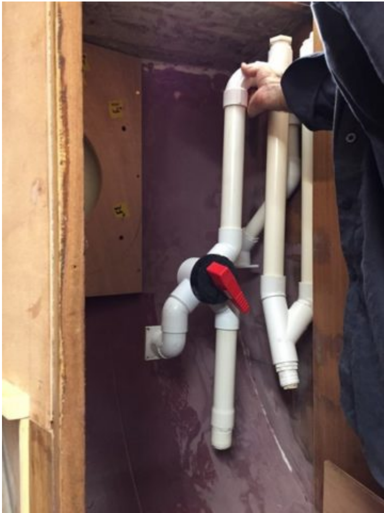
Positionnement de l'orgue à prouts