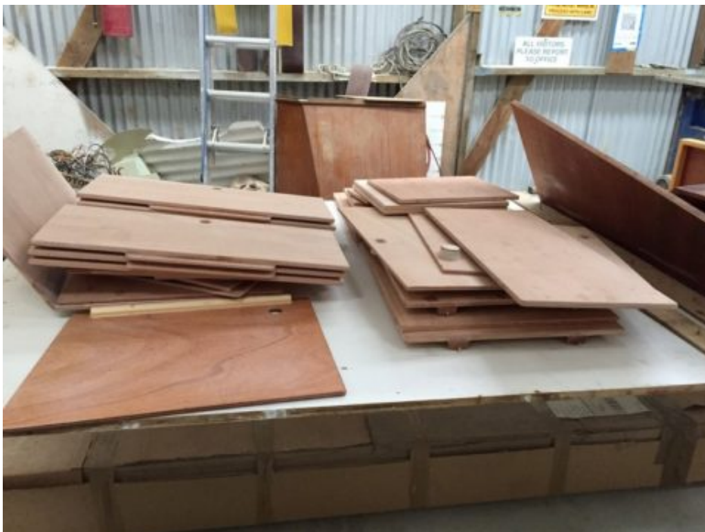
panneaux en attente d'être résinés