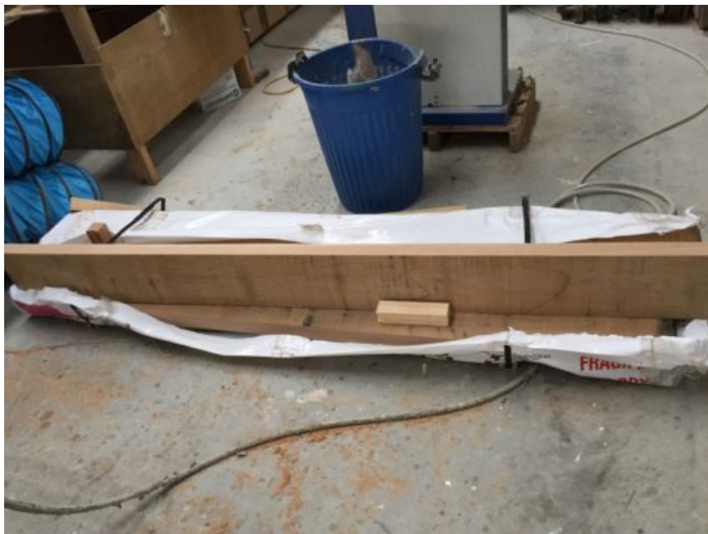
Le colis vu de loin