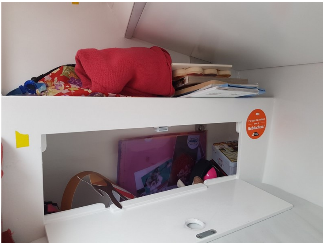
Le « bazar »